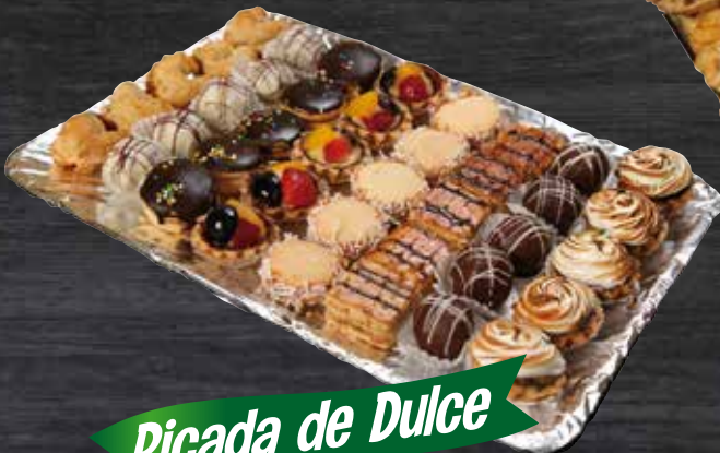
Picada de Dulce