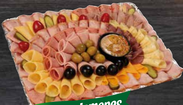
Quesos y Jamones

6 personas $ 18,90 10 personas $ 25,75 15 personas $ 33,75