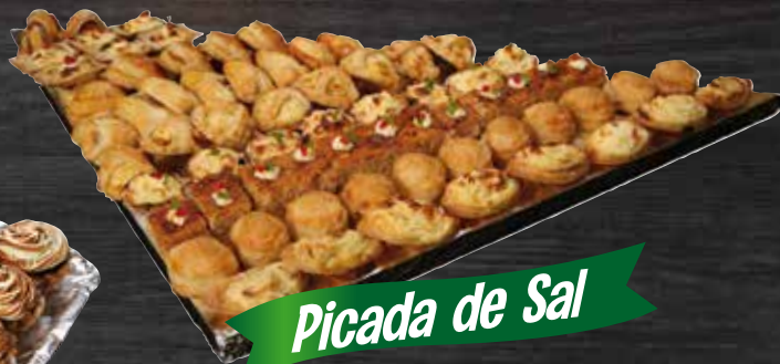
Picada de Sal

6 personas (25 unid.) $ 20,75 10 personas (40 unid.) $ 28,99 15 personas (60 unid.) $ 39,99