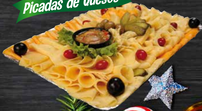
Picadas de Quesos

6 personas $ 18,90 10 personas $ 25,75 15 personas $ 33,75